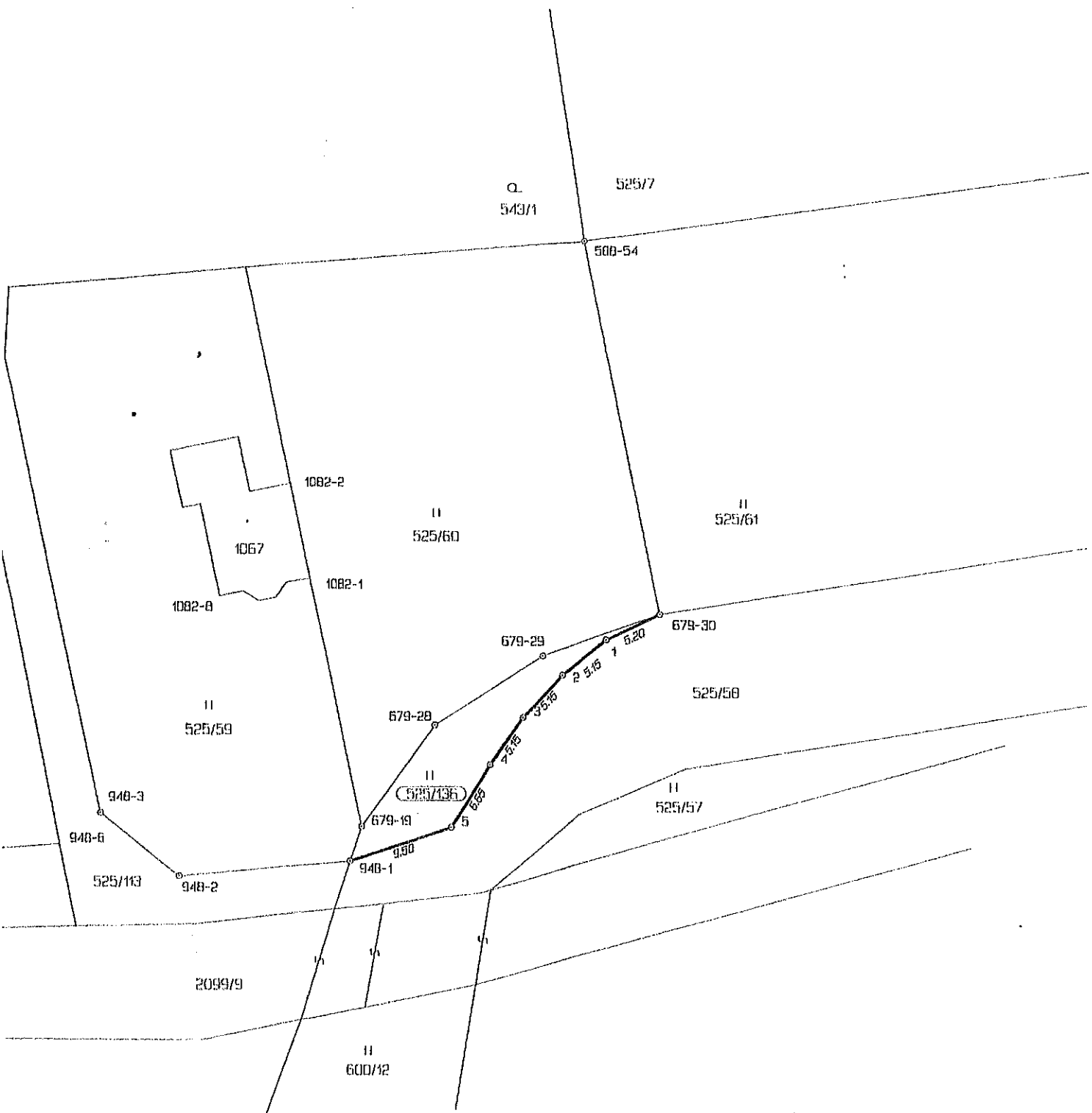
Seznam souřadnic (S-JTSK) Číslo bodu Souřadnice pro zopn do KN Y X Kód kv. Poznámka