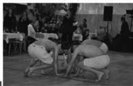
Na Vaši účast se těší pořadatelé