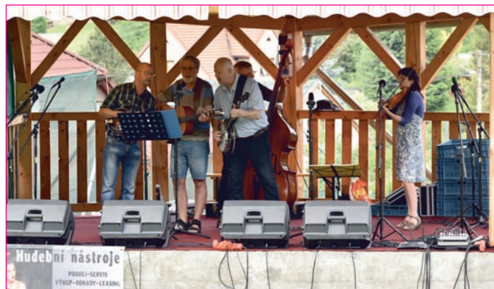
The McMillan's Brothers

Pátý koncert zahájila jako předkapela domácí skupina Ptačoroko, standardním programem i výkonem. Po nich se rozjel BG styl. Přes absenci dobristy s výrazným hlasem, zahráli a hlavně