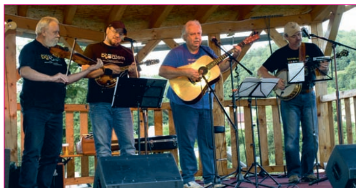
Whiskey Before Breakfast