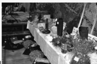
Vstupné na večerní program 50 Kč