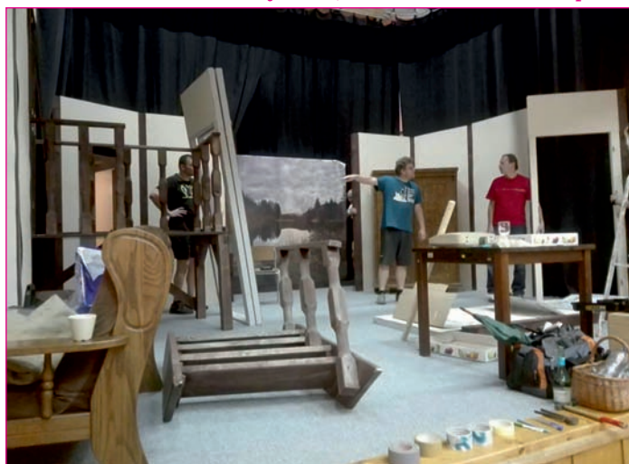
Stavíme kulisy v Palkovicích