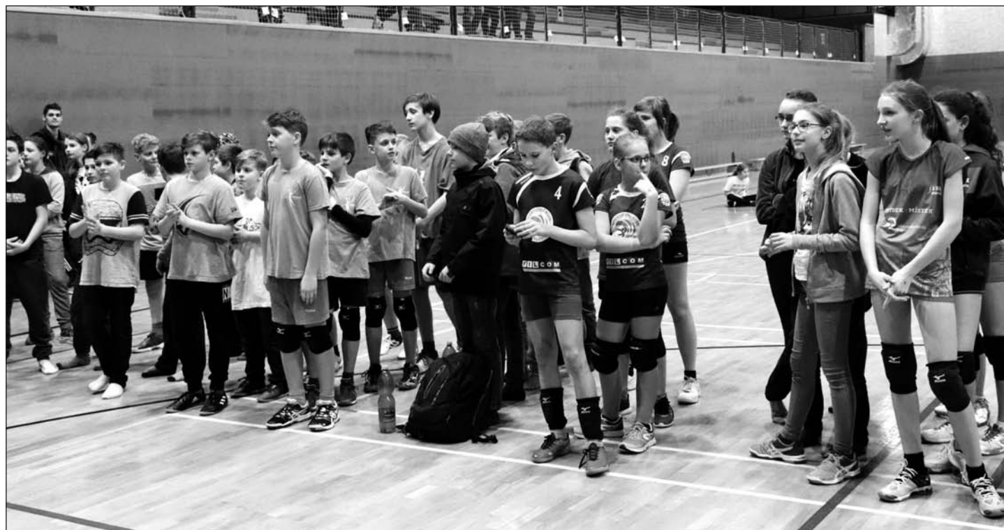
Vyhlášení výsledků soutěže Mladší žáci – Hala Raškovice