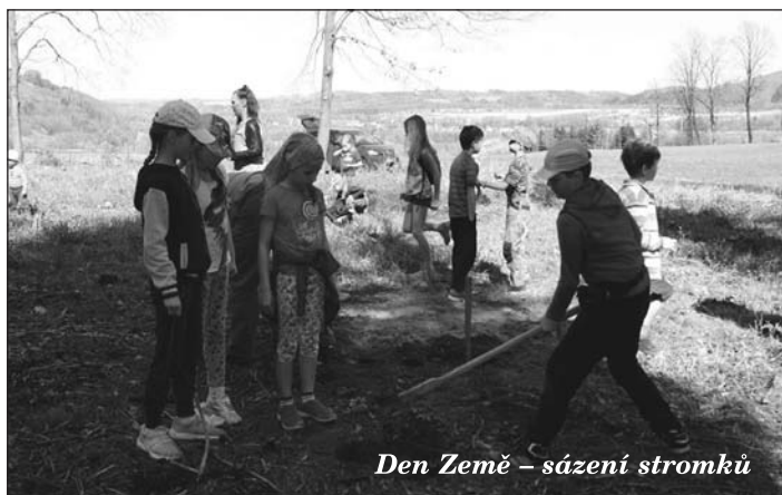
Den Země – sázení stromků

Letos jsme se rozhodli udělat Den Země trochu jinak. Se zástupci naší obce jsme domluvili sázení stromků na obecním pozemku. V sobotu 14. 4. ve 14 hodin jsme s rýči a kopačkami vyrazili od Dvořáčka směr „Maliniska“, kde už na nás čekalo 500 sazenic!