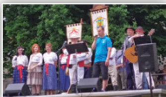
▶ CYRILOMETODĚJSKÁ POUŤ ◀