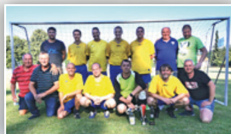
◀ STARÁ GARDA NA TURNAJI VE FRYČOVICÍCH ▶