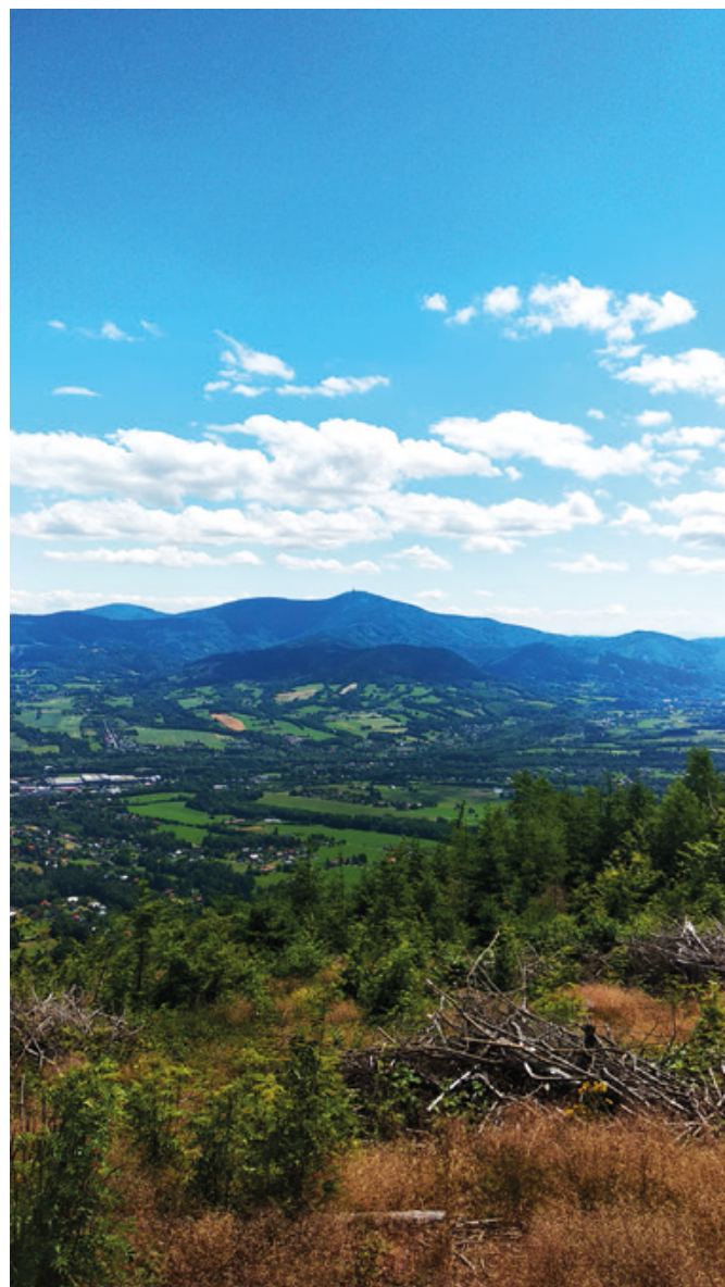
Vítězná foto v červenci