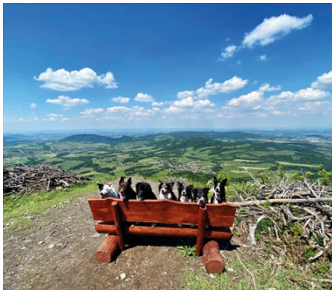
Vítězná foto v červnu

Fotka, která má v daném měsíci nejvíc lajků získá věcnou cenu.