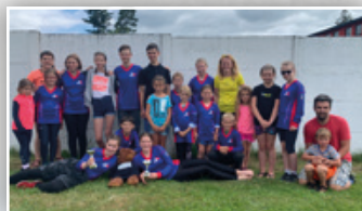
◀ ÚSPĚCH MLADÝCH HASIČŮ ▶