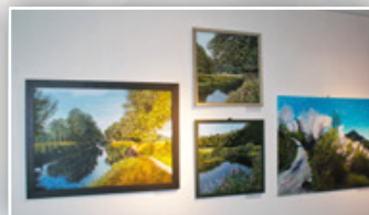
▶ VÝSTAVA OBRAZŮ „BAREVNÝ KONÍČEK“ ◀