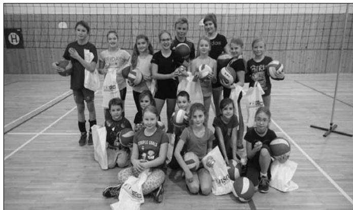
Vánoční volejbalový turnaj 2017