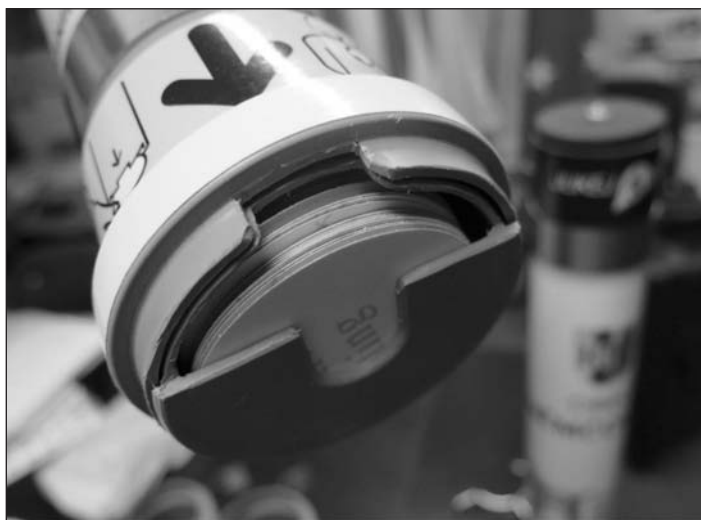
Detail vydávacího otvoru pro samolepky.

Obsluha zásobníku je rychlá a intuitivní. Aplikace nálepky je velice snadná.