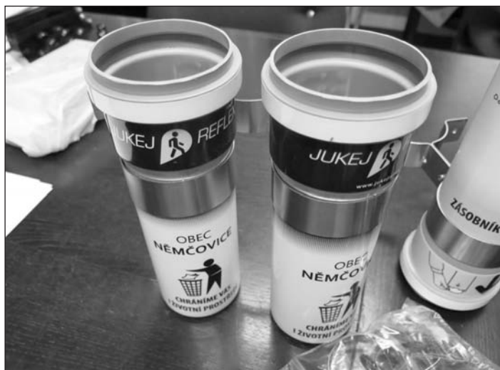
Zásobník reflexních prvků a koš na zbytky po samolepkách.

Sdružení místních samospráv ČR svým členům nabídlo v rámci projektu Nadace České pojišťovny a.s. bezplatné dodání jednoho zásobníku s retroreflexními nálepkami. Obec Metylovice tedy projevila zájem a obdržený tubus s reflexními terčíky umístila na sloupek u autobusové zastávky Metylovice – Mužný, kde jej bude moci každý chodec použít k ochraně své osoby před plánovaným pohybem po neosvětlené komunikaci.