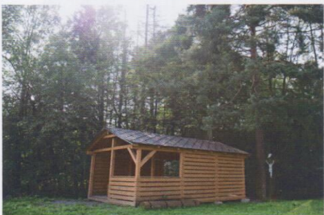
Pasivní odpočinek Boží muka