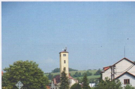
Chodník v úseku ZŠ - OÚ