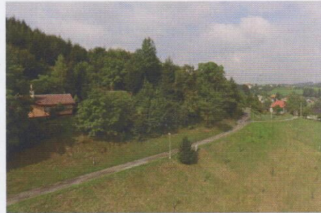
Osvětlení cyklotrasy nad sadem