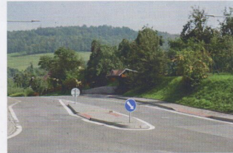
Bezpečnostní prvky na Vrchovině