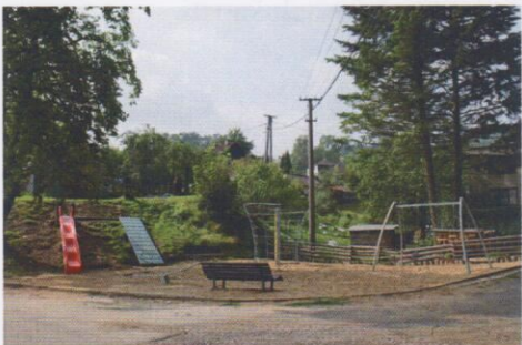
Dětské hřiště v pasekách