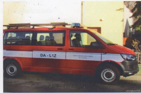
Koupe nového auta pro hasiče