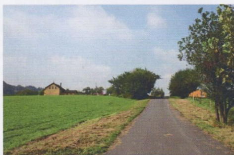
Oprava komunikace Metylovičky