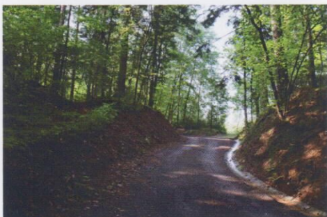
Zpevnění cesty na Zamrklí