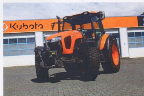
Traktor Kubota pro sběrný dvůr a kompostárnu