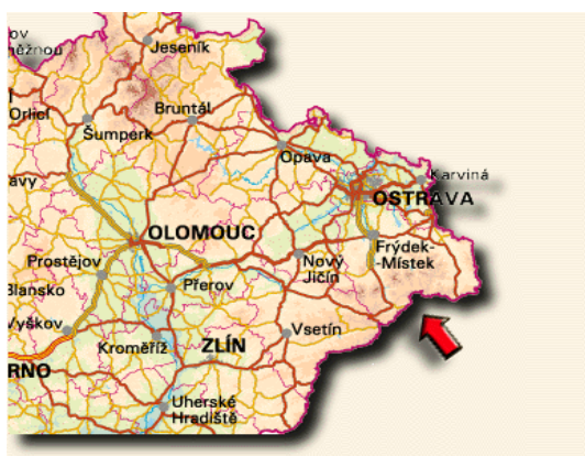
Obrázek: Správní obvod Frýdlant n. O.